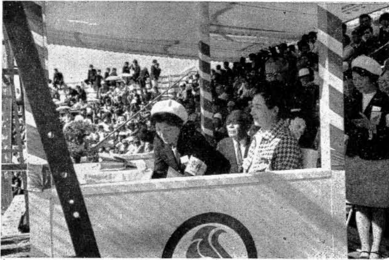
女子高校の優勝戦をご覧になる妃殿下