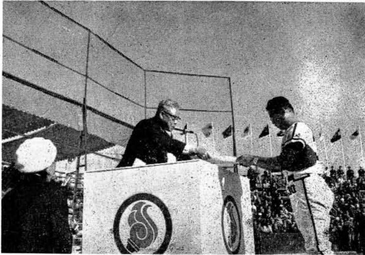
十月三十日 表彰状を受けとる優勝佐世保重工のチーム