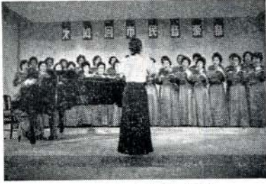
ママコーラスも出演