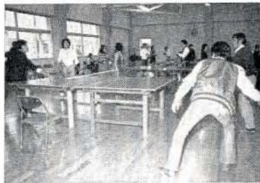
熱戦をくりひろげた卓球大会

つくろう市民の音楽祭を。と第十四回市民音楽祭は三月三日午後一時から市民会館で開催されました。 尺八・琴・器楽の演奏やガールスカウト・少年合唱団・ママコーラスなど、もりだくさんの出演で市民音楽祭は年々参加者が増えて盛大になっております。