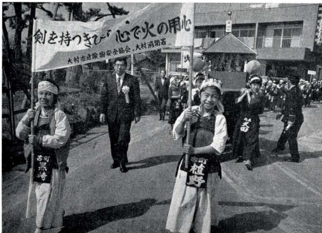
プラカードを先頭に元気よく『火の用心』を呼びかけた少年剣士の皆さん