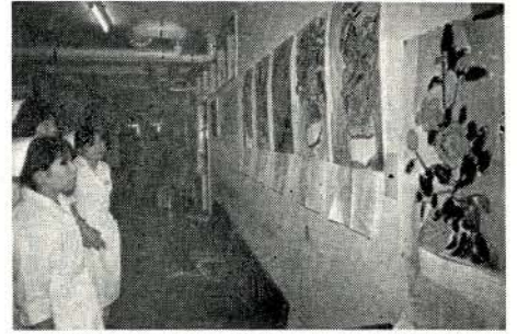
市立病院の廊下に飾られた「つばきの絵」