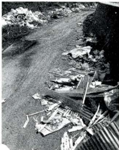
松山海岸道路に捨てられたゴミの山

最近とくに海岸や公園、あき地などに、ゴミや汚物をかき捨てて捨てる人が多くなり、環境衛生上、目にあまるものがあります。 廃棄物の処理については、市衛生課に申し出て、指示をうけてください。 不法投棄をすると「廃棄物処理及び清掃に関する法律」により、罰せられますので、ご注意ください。 明らかに健康な都市づくりの監視員をおいて、取り締まりを強化します。