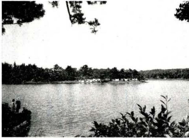
山開きを待つ野岳キャンプ場

十二人用六百円、五、六人用三百六十円、四、五人用三百円 ◆毛布の貸出料 掛毛布四十円、敷毛布三十円 ◆施設の内容 洗い場三カ所、野外炉三カ所、便所四カ所、シャワー室四棟、給水施設完備 くわしいことは商工観光課または、野岳キャンプ場管理事務所（電話八二五四番）へおたずねください。