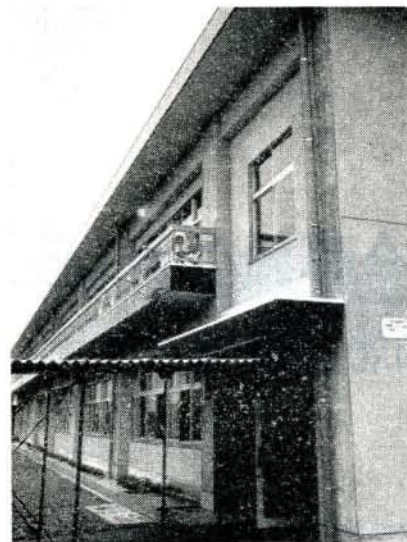
完成した鉄筋校舎

木造危険校舎として改築をいそいでおりました三城小学校は総工費三千八百万円、普通教室九、特別教室三、その他一教室、延べ千三百五十五方メートルのりっぱな近代施設を誇る鉄筋校舎になりました。落成式には全校生徒