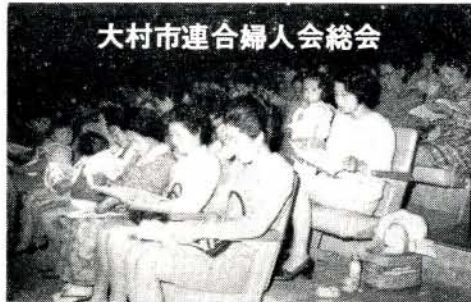
会場をうづめた婦人会の皆さん

花の季節も終わりをつげた四月二十七日午前十時、大村市連合婦人会の総会が市民会館で盛大におこなわれました。