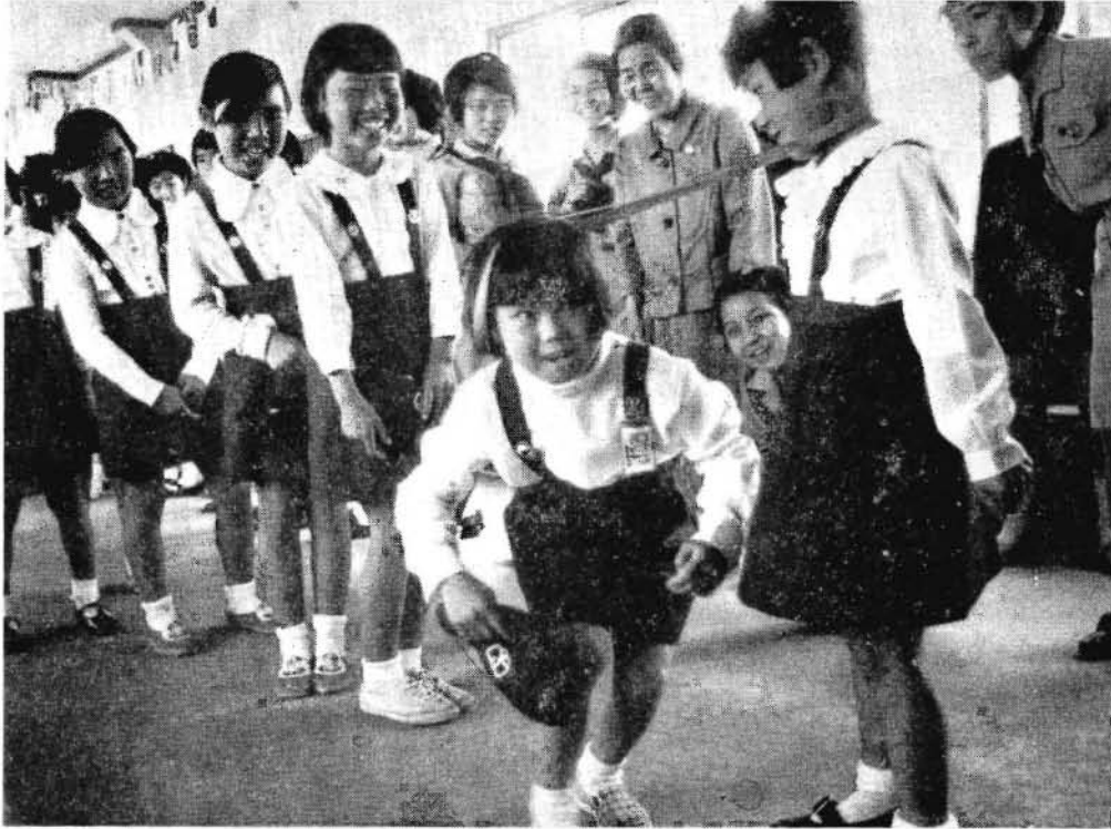
ゲームを楽しむ団員のみなさん

交通事故相談日 5月25日(火) 10時～15時 市役所第1会議室 なるべく事故に関 係の書類をご持参 ください