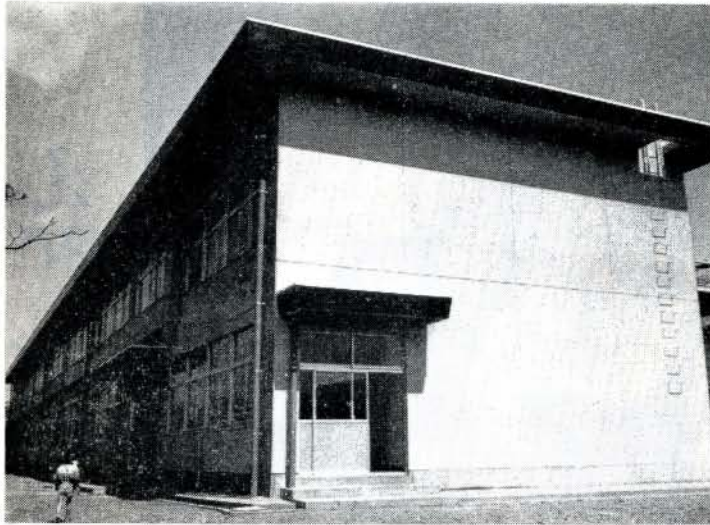
近代化する学校建築（三城小学校）