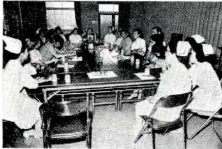
看護婦さんたちと医療問題の座談会