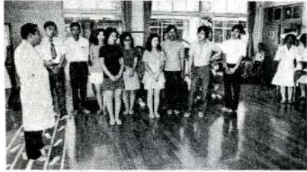
リハビリテーションを勉強