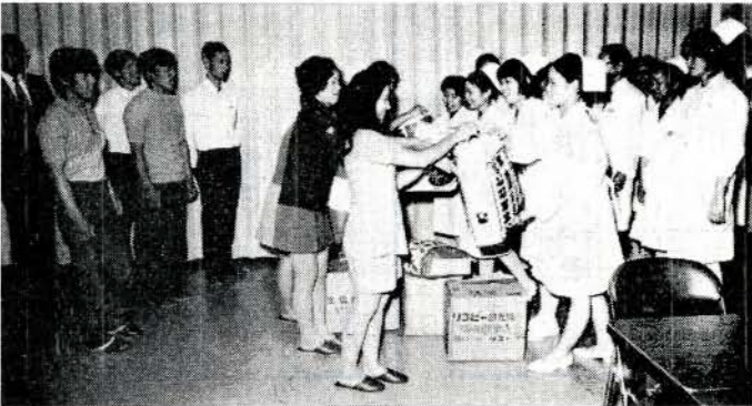
「高齢者のかたへあげてください」と肌着類をプレゼント