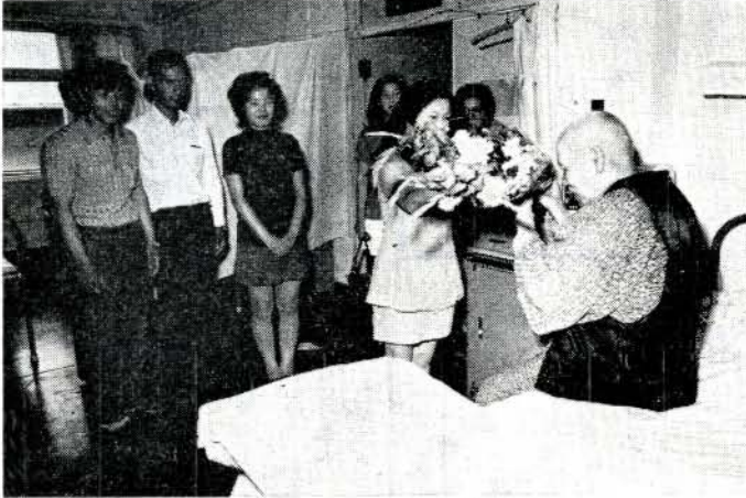
「早くよくなってください」と花束の贈呈