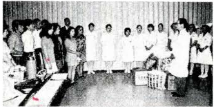
尾崎院長からお礼のことは