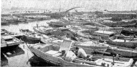
写真 新城港の漁船のむれ