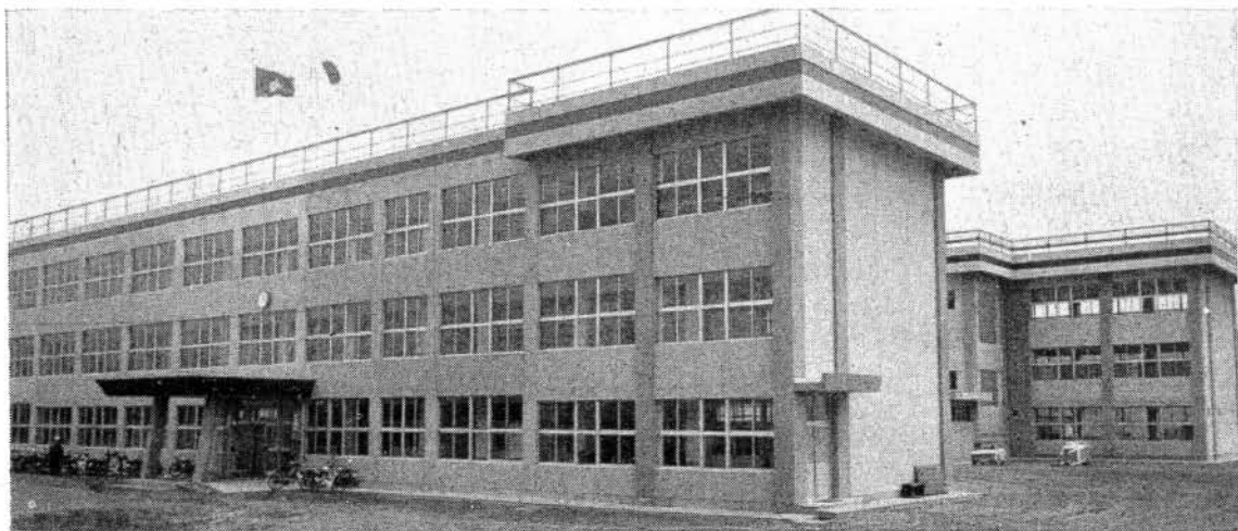
写真上=新しい玖島中学校舎

□昭和33年4月22日第三種郵便物認可 □毎月3回1日・10日・20日発行 □定価1部5円 □発行所 大村市役所 □編集人 総務課長 菊池綱昌 □印刷所 隆文社印刷所