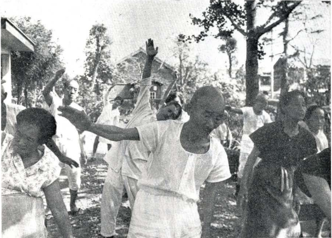
元気に朝のラジオ体操