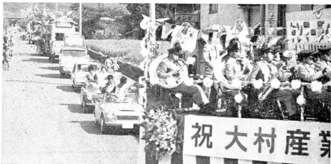
下=市内をねりあるく仮装行列