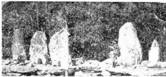
〔写真〕菅無田合戦での戦死者の墓

菅無田の合戦 ② 竜造寺隆信は朝早く琴平岳の中腹に陣を取り昨日の敗戦をとりもどさんとして、第一陣の将銅鳥飛弾守は決死の覚悟で正面より、第三陣神代弾正忠は搦手(裏門)より攻め寄せた。菅無田勢は前後に敵を受けて苦戦したが弓、鉄砲を放ち敵をなやまし、討ち取る数も少なくなかったが、味方もまたつぎつぎ討死にし疲労の色が見えてきた。かゝる折に敵軍砦に入り火を放ったのもはやこれまでと覚悟を定め一丸となって砦より討って出て敵陣に斬り入り壮烈な最後をとげた。この日の激戦で敵味方のしかばねは砦