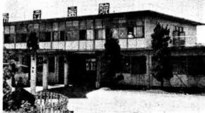
写真一現在の市立病院

一年九月から診療を開始した。昭和三十三年には全館が完成しベット数約二百七十、職員数約八十名で、整備された病院となった。その後増築工事なども行なわれ、現在ベット数約三百で市民医療サービスセンターとして活躍している。