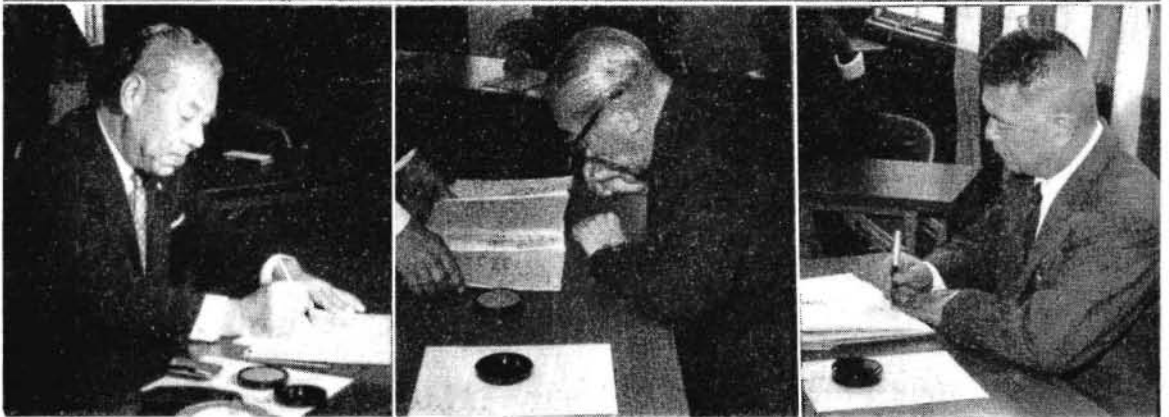
空港予定地箕島の遠景