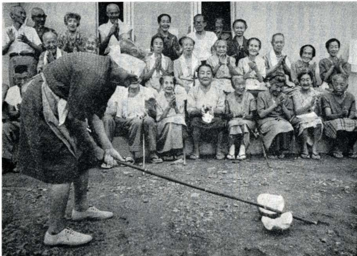
すいか割りを楽しむお年寄りのみなさん(市立清和園)