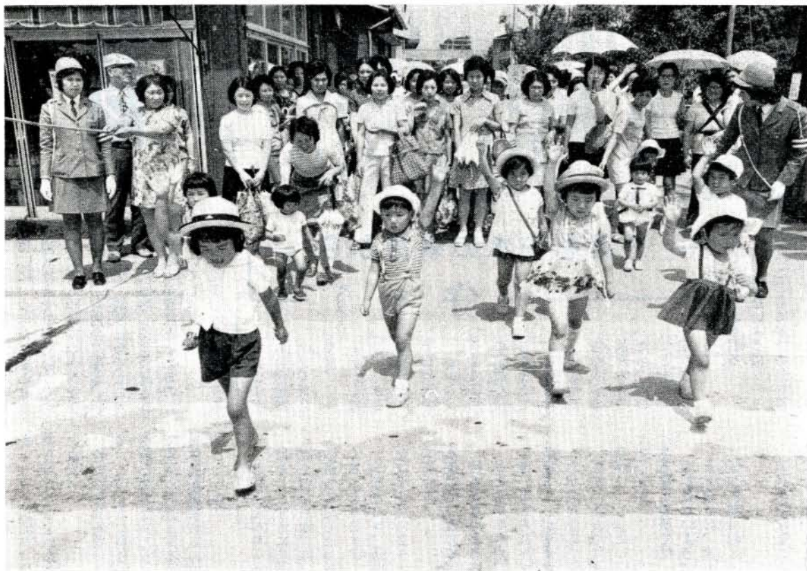
交通安全教室の実地指導で母の会のみなさんが見守る中を横断する子どもたち