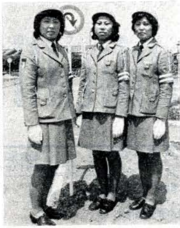
制服姿の婦人交通指導員のみなさん

今年度から市に、三名の婦人交通指導員がおかれることになり、長崎市で必要な教養と訓練をうけてきました。