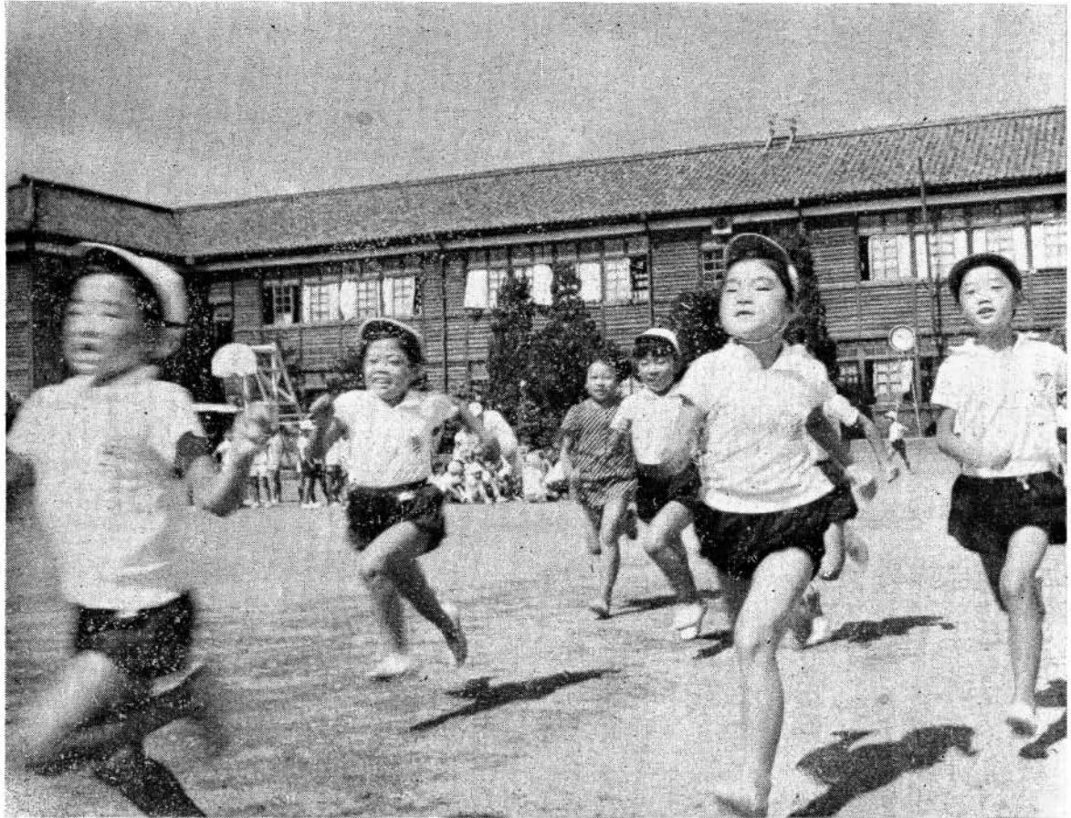
練習にはげむ生徒たち