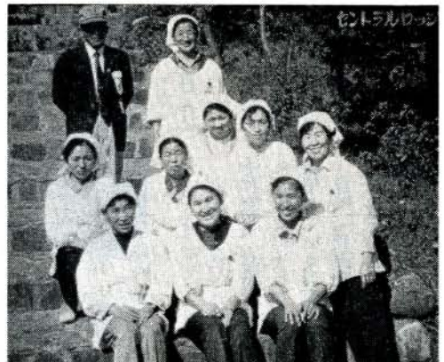
～キャンプ場の清掃を終えて～