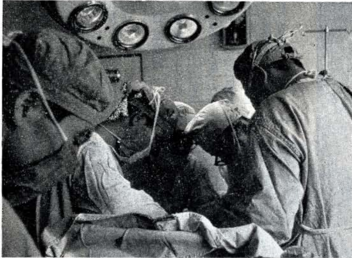
近代設備の中での手術 (市立病院)

病院事業について 交通事故、あるいは、脳卒 中等による患者の完全治療及 び早期回復をはかるため、リ ハビリテーション、(機能回 復棟)及びI・C・U・(集 中治療監視室)の整備を行な い、十分なる活用をはかると ともに、医療機械器具の整備 拡充、医師住宅の新築等を行 ない、医師の確保についても 最善の努力をしたいと考えて