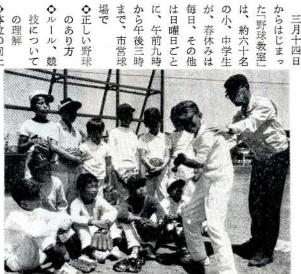
打撃のコーチをうける生徒たち

三月十四日からはじまった「野球教室」は、約六十名の小、中学生が、春休みは毎日、その他は日曜日ごとに、午前九時から午後三時まで、市営球場で ●正しい野球のあり方 ●ルール、競技について ●体位の向上 について、いっしょうけんめい汗を流しました。 五月二十三日と三十日には少年野球大会が開催されるので、みんな真剣に講義を聞いたり打球練習やら打撃練習、最後に練習試合をして終了しましたが、技術もすばらしく向上し、指導にあたられた野球協会のかたがたも大へんよろ こんでおられました。 大成功に終わった「野球教室」を機会に、体育課では今後どんどんこのような「教室」を開催していく計画です。 目下「登山教室」が、五月六日から山岳公認指導員のもとに中央公民館で開催され、大へん好評をばくしております。