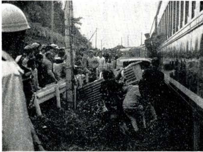
太良町の踏切事故 46.4.17撮影

市政が市民生活に密着し、よりよい生活環境をつくりだすために、市政モニター制度を実施しておりますが、五月十二日、市役所大会議室で今年度初の会合が開かれました。 まず、モニターの任務について、つづいて市の現状についての説明があり、質疑がある。それぞれ市政モニターとしての自覚をあらたに閉会いたしました。 市では、モニターのかたが