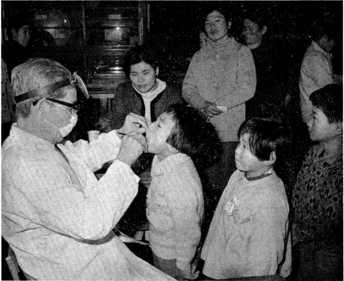
むし歯なんかないと思つたが…… —三浦小学校にて—

新入学児童のいるご家庭では何かと心づかいをされていることでしょう。これまで、お母さんやおねえさんに手伝ってもらっていた衣服類の着脱も、ひとりできるようにやらせてみましょう。上着のボタンを一ケタ間違えてはめたといつて、すぐになおしてやらずに、間違えた