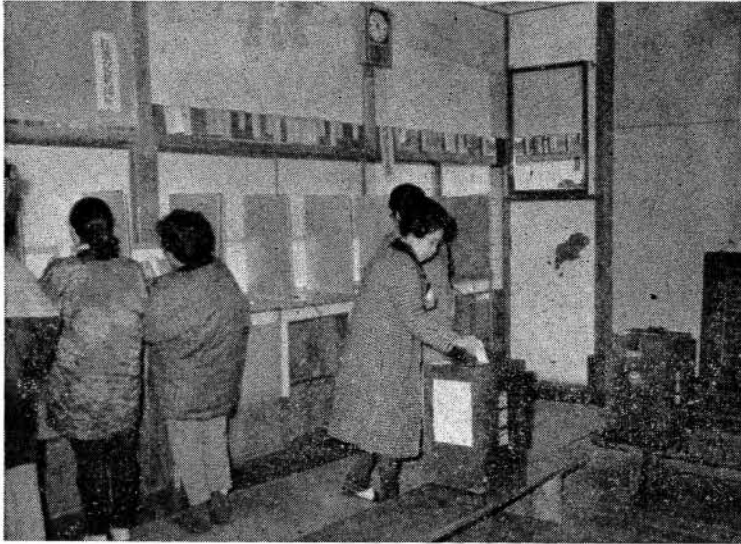
第十投票所（古町公民館）にて