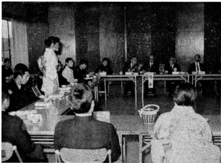
市民会館における座談会