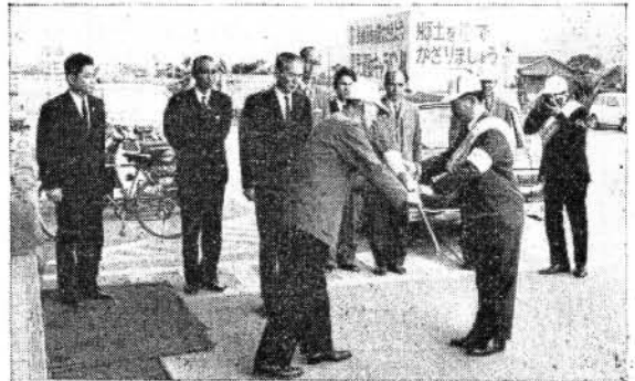
写真 <国体ほうきを贈呈するキャラバン隊>

なお、「国体ほうき」は、衛生課を通じて各地区の婦人会に配布されることになりました。