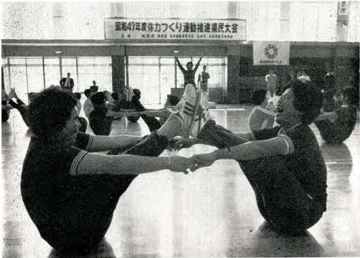
楽しく体操をするママさんたち