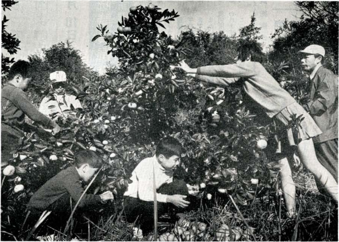
先生の指導でわせミカンの収穫をする児童たち