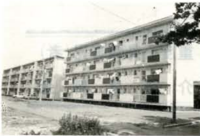
立派な公営住宅に入居できます

公営住宅に入居を希望される人に優遇抽せんの取扱いがなされます。 詳しいことは、市建築課へおたずね下さい。