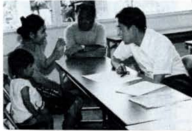
幼児のことばの相談