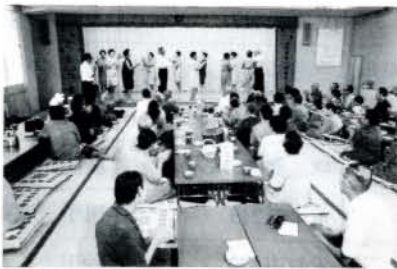
老人福祉センター大広間の催し

総合聴力検査装置で検査を受け、いろいろな相談に応じているのが、「みみとことばの相談室」です。