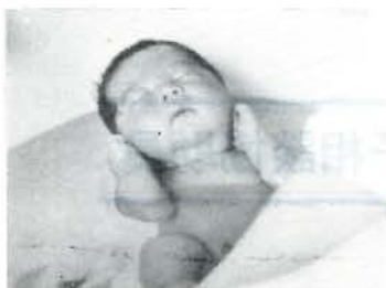
助産施設の利用で立派な赤ちゃんを