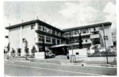
福祉センター全景

老人性白内障で開眼手術が可能である六十五歳から六十九歳までの老人に対して手術費に必要な経費の自己負担額を公費で補助します。