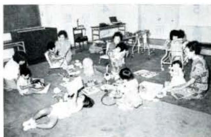
保母さんの介護で楽しい一日保育