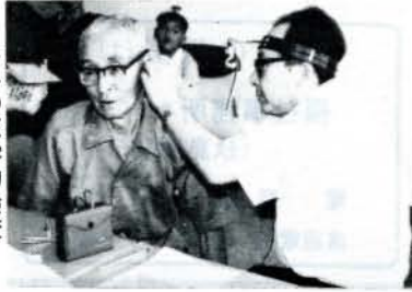
みみの医学的検査

聴覚障害者及び音声又は言語機能障害者のため手話通訳者をおき相談業務を次のとおり行っていますのでご利用下さい。 相談日 毎週木曜日 時間 午前十時～午後六時 場所 福祉センター