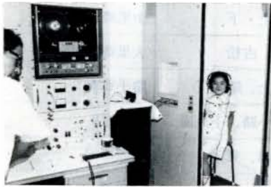
最新式の器械で聴力の検査

毎年七月には老人福祉センターで老人大学が開講され、みなさん熱心に受講されています。