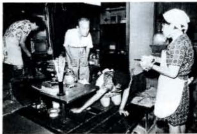
家庭奉仕員の奉仕作業