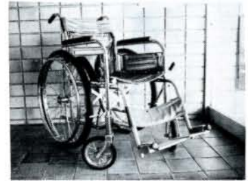
市役所玄関右側の車いす