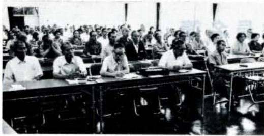
老人大学の受講者

毎年七月には老人福祉センターで老人大学が開講され、みなさん熱心に受講されています。