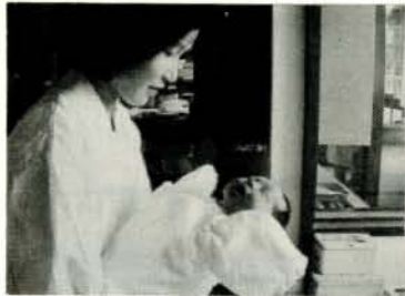
かわいい赤ちゃん誕生(市立病院で)