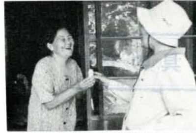
お年寄りに喜ばれている乳酸飲料の無料配達

市は七十歳以上のひとり暮らしの老人に乳酸飲料を毎日無料で配達しています。これは老人の安否を確認すると同時に急迫した事態の発生に対処できる体制を確立し併せて独居老人の安らかな生活を保持するため老人友愛訪問として実施するものです。該当者はすでに調査していますが、もし、漏れている人は地区民生委員または福祉事務所まで連絡して下さい。