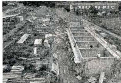
建設中の久原団地