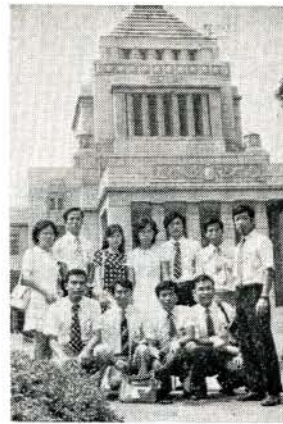
国会議事堂前の研修生