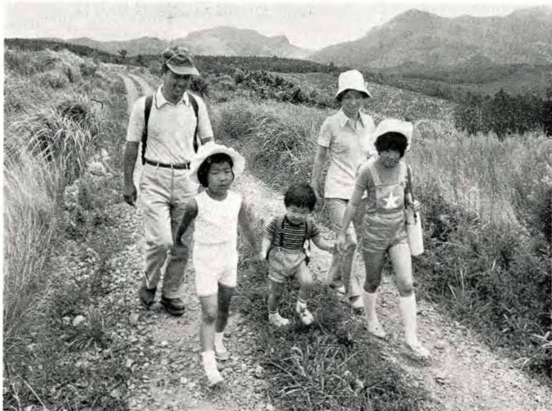
家族そろって楽しいハイキング