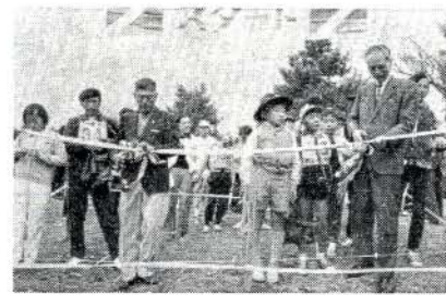
テープを切る深堀体協副会長と朝長教育長(右)

支給対象者 △九月一日現在県内に住所を有し、家庭に在宅する四歳一六十五歳未満の重度心身障害者(児)で食事、入浴、排便及び被服の着脱のすべてに介助を要する者 △児童相談所、精神薄弱者更生相談所の判定による重度精神薄弱者で日常介助を要する者