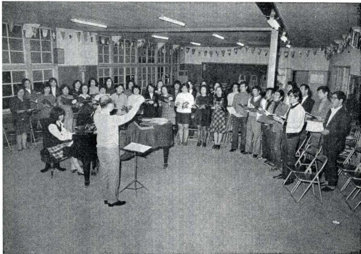
今日も楽しくコーラスの練習に励む大村混声合唱団の皆さん