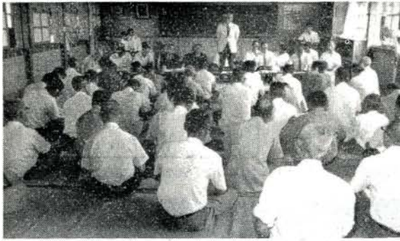
市政懇談会福重会場

去る七月十六日から八地区に分れて開催された市政懇談会は、各会場とも熱意ある意見、要望がたくさん出され、時間を延長する程盛会でした。特に多かった意見、要望は 一、水資源の確保 二、側溝の整備 三、市道の舗装 四、農道の市道編入 五、住民センターの建設 六、老人福祉対策 これに対し市側の回答は 一、水問題については、大切な飲料及びかんがい用であるので、県とも協議し、なんとか解決するようさっそく研究したい。 二、側溝の整備は重点的に年次計画により実施したい。 三、市道の舗装は来年中におおむね完成の予定。 四、農道の市道編入については、規格にあうものから実施したいが、地元関係者の協力を必要とする。 五、住民センターの建設は、南、中、北の三方所に設置したいと考えているが、ま 六、老人福祉対策については九月市議会に七十五才以上の高令者に医療費支給制度を実施するよう上程したい