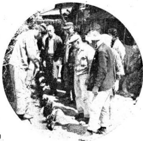
写真＝竹松地区の町内ぐるみ衛生活動

長崎国体も2年後です。きれいな大村、衛生的な大村をつくるため、町内環境の美化にお互いに努力しようではありませんか。