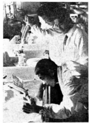
写真一 よう業科実習風景

被服（紳士服・婦人子・和裁科）の各課程があり、いずれも就職率が百パーセントで求人に応じきれない程である。理容科は、一般健聴者と同