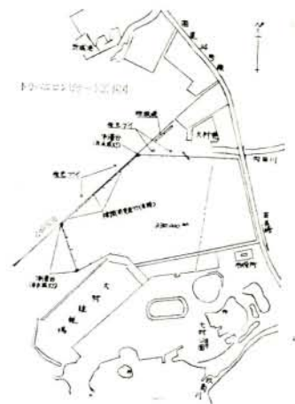
海面埋立工事略図