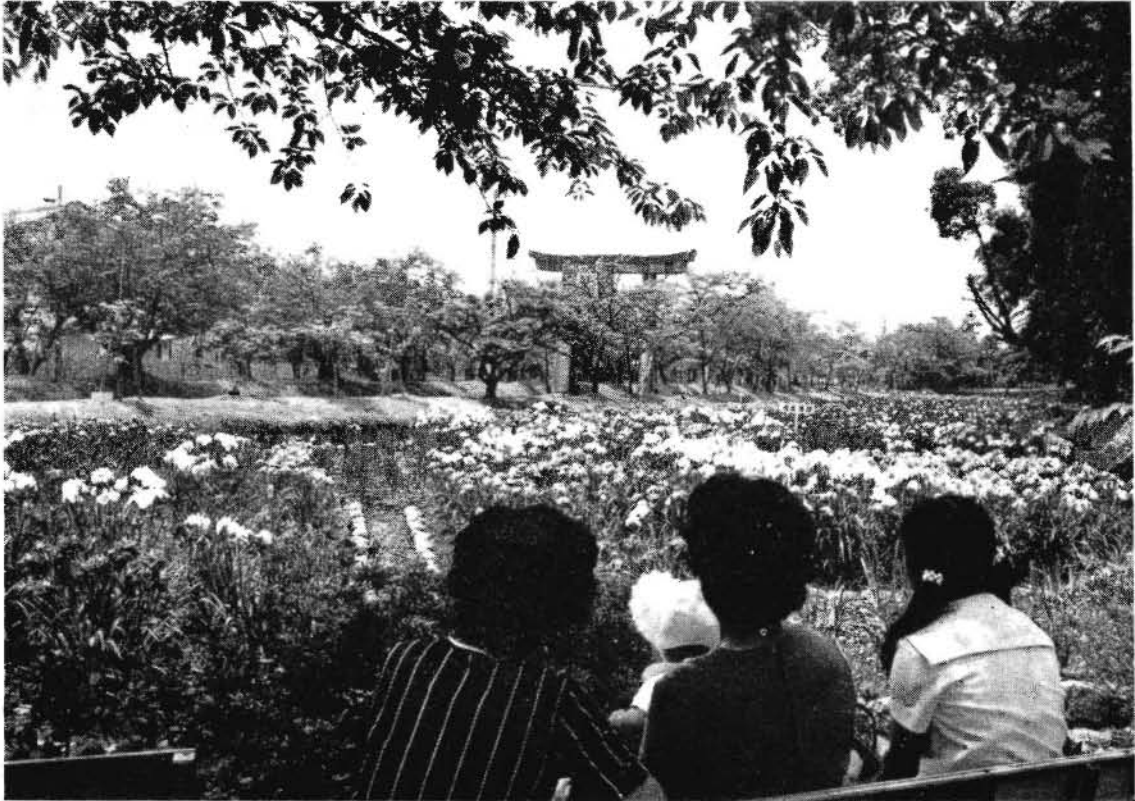
観賞客が絶えない花しょうぶ園