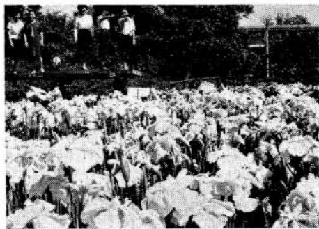
写真=昨年(昭和42年)のしょうぶ

花しょうぶが咲き始めました 大村公園、桜田ノ堀よこのしょうぶ園の花が咲き始めました。花の見頃は6月12日から17日ごろまでです。 桜田の堀にも5羽の白鳥、4羽のおしどり、かもなどが市民みなさんのおいでを待っています。 写真=昨年(昭和42年)のしょうぶ