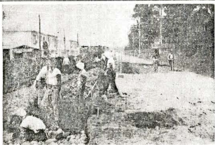
きれいになる市道乾馬場線

市内四町住宅角から大村部隊横の市道乾馬場線の舗装を十月一日から実施している。この道路は延長三百二十米、巾六・五米のコンクリート舗装で、十二月末に完成の予定です。