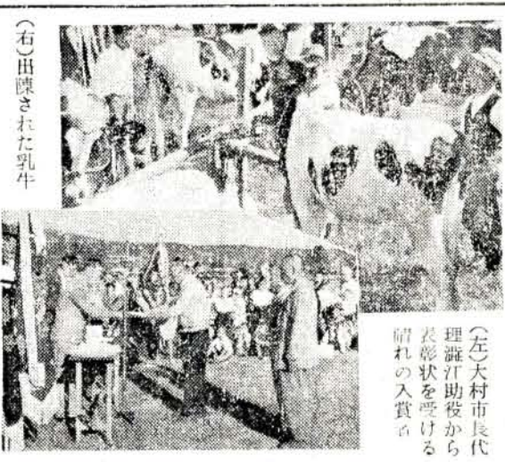
(右)出陳された乳牛

国民のスポーツ祭典第廿二回国民体育大会が十月二十六日から三十日まで五日間、静岡県で開催されます。この大会に大村市から次の六名が長崎県選手として参加します。