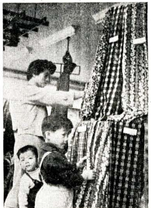
(おかあさんの買物に坊やお手伝い)