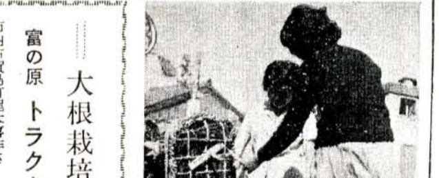
(写真は=店先に積まれた炭)

富の原トラクターの深耕で したが、トラクターによる深耕で、今後大きな期待がもてることになりました。 〔写真〕右側がトラクター深耕地につく大根