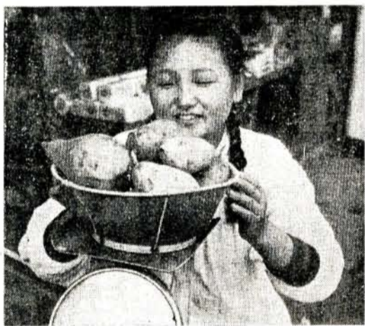
(計量器にのった甘しよ...)