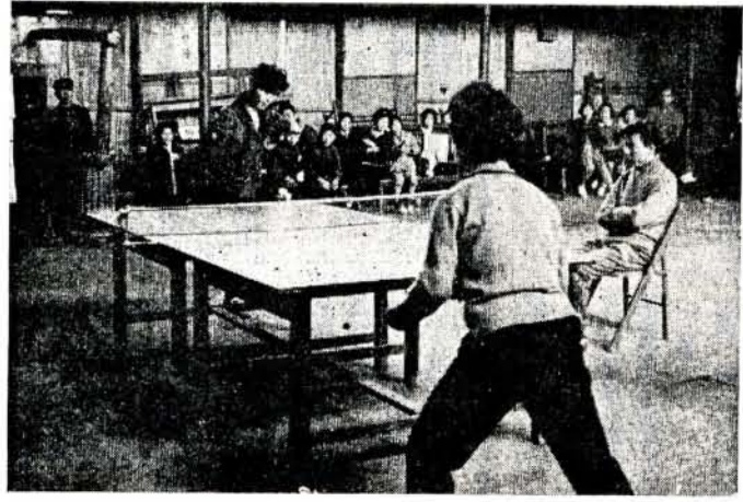
おかあさんの熱心な試合ぶり

また、四月七日補助グラウンドではじめて、前丹洋公民館と同木場公民館の親善ソフトボール試合が行なわれました。