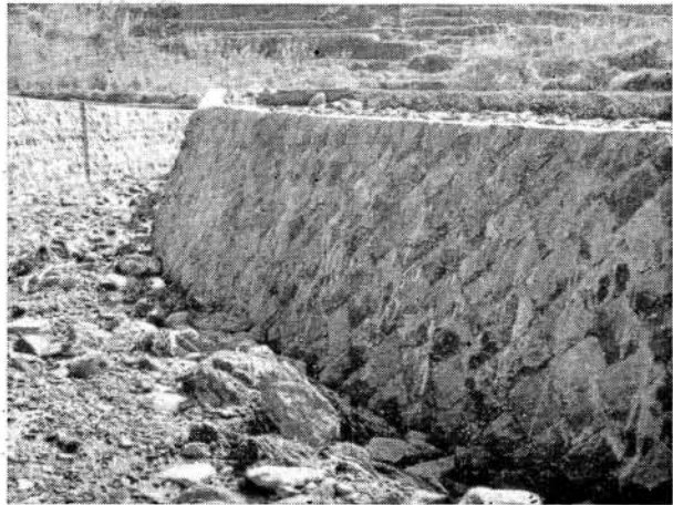
37年水害の復旧工事