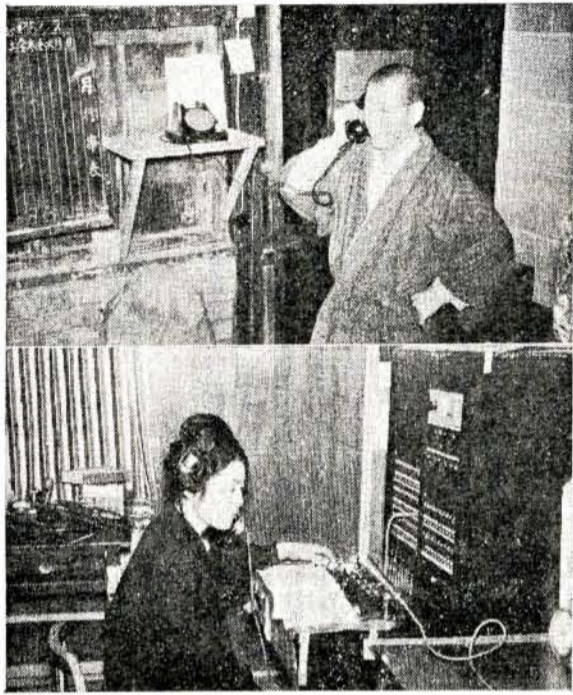
上=自宅で喜びの通話 下=放送・交換室

昭和三十三年四月一日から実施されますので、福祉事務所では「資格取得届」を受けつけています。該当者で、この届を出していないかたは、いそいで届を出してください。