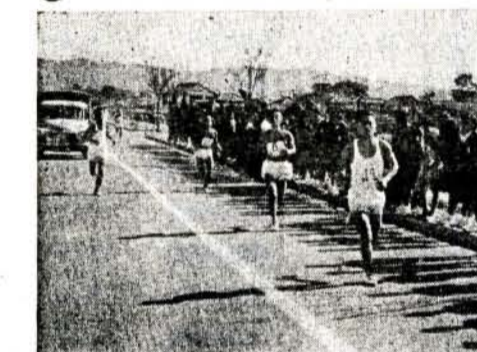
市内中学校駅伝競走二区(鈴中)は今年で十一回をむかえ、秋島崎海水浴場入口と松原の火力発電所入口の折返しコースで十一月十日盛大に行われました。

恒例の市内中学校駅伝競走二区(鈴中)は今年で十一回をむかえ、秋島崎海水浴場入口と松原の火力発電所入口の折返しコースで十一月十日盛大に行われました。