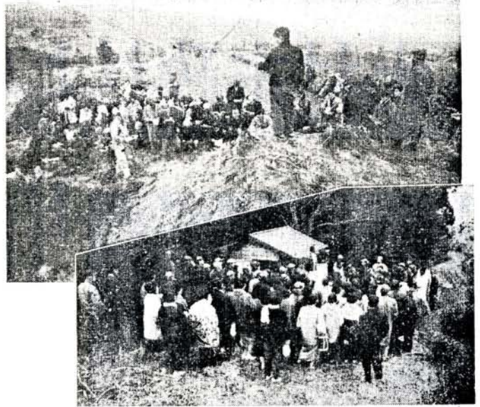
写真上：造成現場で説明