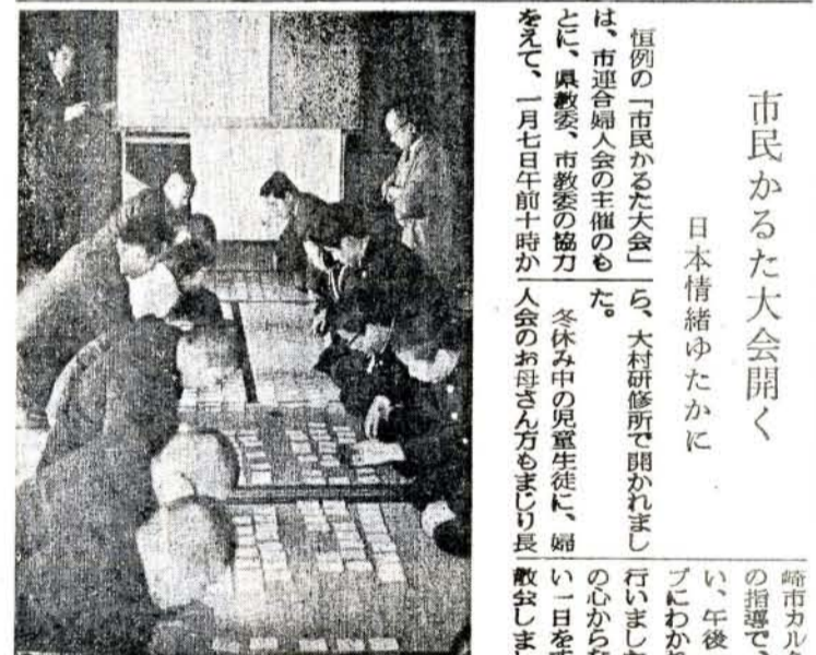
市民かるた大会開く 日本情緒ゆたかに 恒例の「市民かるた大会」は、大村研修所で開かれ、市連合婦人会の主催のもと、県教委、市教委の協力にて、一月七日午前十時から午後三時三十分まで、大村市議会議場で行なわれた。冬休み中の児童生徒に、婦人会のお母さん方もまじり長教員も参加した。

△売却方法 一般競争入札 △入札日時 一月三十一日午前十時から十三時三十分まで △入札場所 大村市議会議場 △入札保証金 入札金額の百分の三以上で現金とする。 その他くわしいことは財務課へ問合せください。 (財務課) たばこは市内で買いましょう