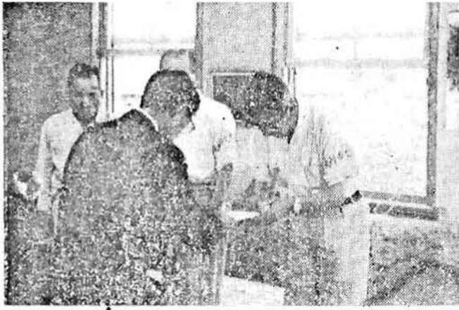
写真はご下賜金の伝達