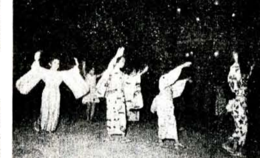
写真(上)きれいにできた佐古の川遊園地(下)手ぶりもあざやかなぼん踊り