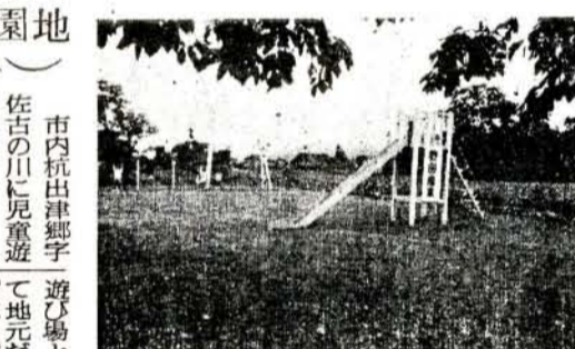
写真(上)きれいにできた佐古の川遊園地(下)手ぶりもあざやかなぼん踊り

市内杭出津郷字遊園地として地元で利用できるだけの子どもたちが利用できる遊園地ができました。この敷地はパブテ空地となっていたところを借り受け整備し、去る八月十九日にめでたく開園されたもので、子どもたちの健全な