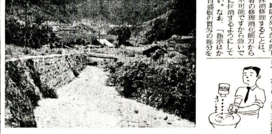
菅瀬北川内、店川は勾配が急なため、昭和三十二年七月二十五日水害で川底が洗われ、延長百九十三メートルを実施しました。(写真は底張りされた店川)