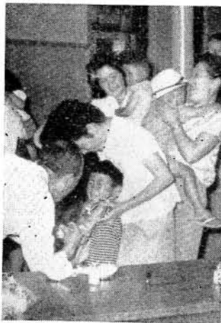
予防注射を受けるよいこ

ご提出になった調査票は統計以外の目的には使用いたしませんので、ご迷惑でしょうが、調査員が訪問したときはよろしくお願いいたします。