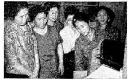
機械室で印刷物のできのを熱心に勉強

市の連合婦人会は今年から婦人見学学級をつくり市内にあるいろいろな施設を見学して勉強をすることにし、その才一回目として六月一日約三十名の婦人会の人たちが市役所を訪問されました。市では三班に分れていたが、総務課長などが直接市民に接している衛生課、保険年金課、市民課、課税課、収納課をはじめ総務課の計算室などを案内し約一時間にわたって