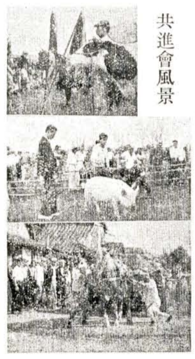
(上)晴れの受賞 (中)豚の審査 (下)馬も挽き手も汗みどろの運搬競技