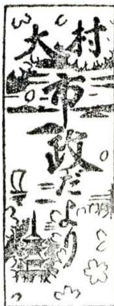
発行所 大村市役所 印刷所 大村市印刷所