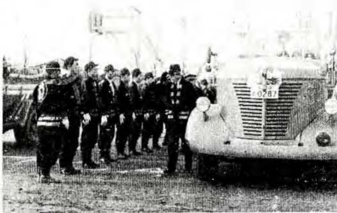
機械器具を点検する大村市長

③ さらにその上を防水紙で包む。少し幅を広く切って重なりはがれないようすずか力をおくつぎの仕事がやりやすい。おくとつぎの仕事がやりやすい。おくとつぎの仕事がやりやすい。 ④ はがれないようすずか力をおくつぎの仕事がやりやすい。おくとつぎの仕事がやりやすい。おくとつぎの仕事がやりやすい。 ⑤ 重ね目が下を向くように下部からフェルトテープをグルグル巻きつける。上向きだと重ね目から水が浸み込むおそれがある。 【注意する点】 地面に近い部分は気温の影響を受けやすいから、少くとも地中七センチくらいのとこまででは保温した方がよい。実際に防寒の役目をするのはフェルトだが、フェルトに水が浸み込むと防寒どころか、かえって逆効果になる。防水紙やビニールテープはそのために使います。よく布切れだけで巻いているのを見かけますが、いくら厚く巻いても防水管の内側の膨脹に差を生ずるが、管が破裂しますから、熱湯は絶対に禁物です。 感心しない美観 「ワッシャー」 「水道の防寒手当をしなかつたからなのよ」