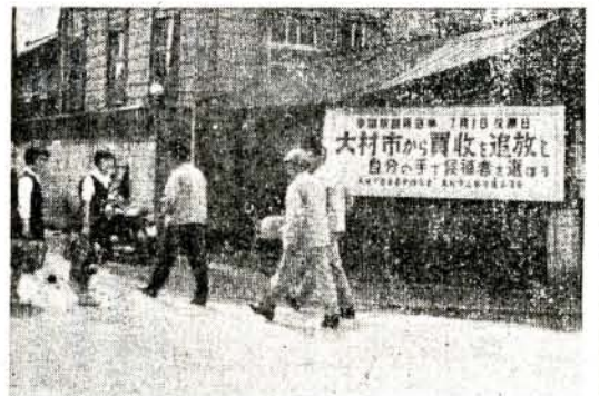
7月1日は参議院議員選挙