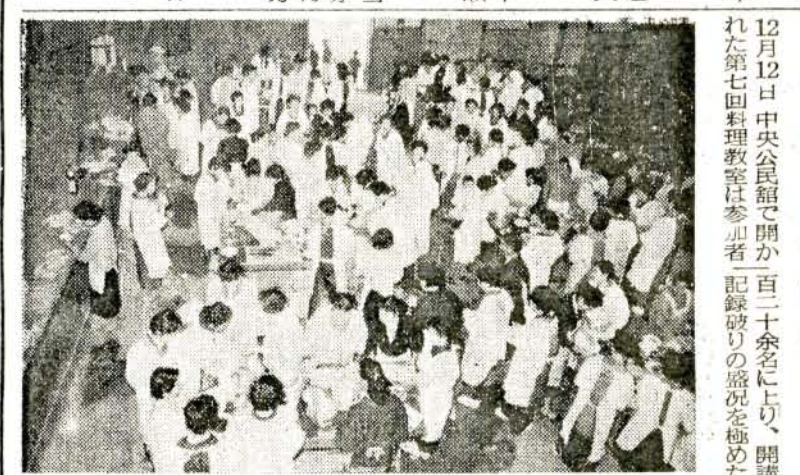
写真は楽しいお正月は、この胸でと庖丁を握る手にも喜びが……

お正月は一家楽しく 12月12日中央公民館で開か れた第七回料理教室は参加者 記録破りの盛況を極めた。 〔正解本文〕 一、泥棒を予防するため、鍵 二、泥棒を予防するため、家 を(守)にする(母は隣 の家と派出所にお願いする。 三、押売を予防するため、昼 間でも(空)の鍵はかけてお きます。 四、痴漢を予防するため、