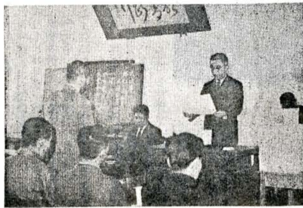
贈れの入賞者表彰……甘藷の一等