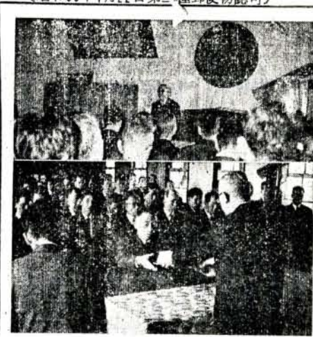
写真上=式辞を述べる大村市長 下=職員表彰

三月の実弾射撃 陸上自衛隊大村部隊では池田射撃場で実施する三月の実弾射撃日程が、つぎのとおり変更になりました。