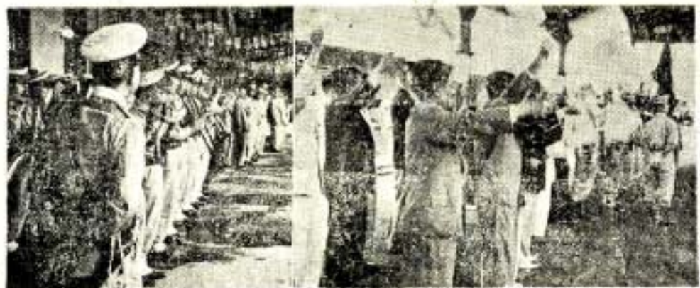
7月7日大村驛頭の歓迎陣