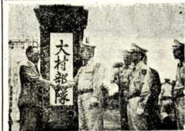
御原市長と平井部隊長感激の握手

提灯行列の情景を彷彿として眼前に想ひ浮ぶるのであります。又七月一日、兩部隊先遣隊が到着して新キャンブの空高く感激の國旗を翻るとして初掲揚致しました御歓迎の心、更に又本日御懸念なる御心遣しを考へます時、誠に感激の至りに堪えない次第であります。