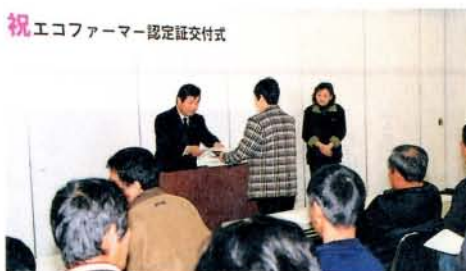
祝エコファーマー認定証交付式

法律に基づいて、たい肥などによる土づくりと化学肥料・農薬の使用低減を一体的に行う内容の生産計画が認められた農業者46人に、県からエコファーマー認定証が交付されました。今後皆さんは、農薬や肥料を散布した日や量などの作業記録をつけながら、環境に配慮した安全な農作物づくりを進めていきます。昨年9月に認定を受けた29人と合わせ、大村市の認定者は75人となり、県内自治体では2番目に多い認定者数となりました（県全体で739人）。