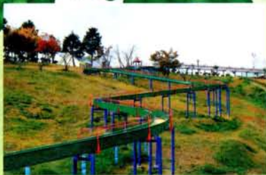
B ローラースライダー