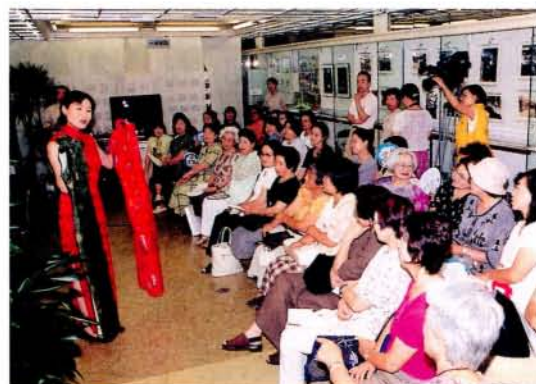
エキゾチックに変身！チャイナドレス教室

■まちかど研究室事務局 (本町アーケード3丁目広場前) TEL / FAX 20-8271