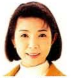
市毛 良枝氏 (女優)