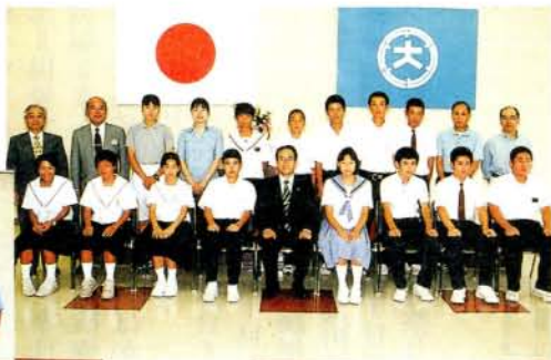
九州中学校体育大会・全国中学校体育大会出場・陸上競技・新体操・水泳競技・野球・バトミントン、各選手の皆さん (8/2・市役所)