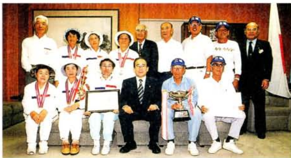
第15回全日本ゲートボール選手権大会出場・三城チーム 第9回九州女子ゲートボール選手権大会出場・親和寿会チーム (8/31・市役所)