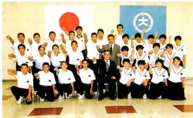
全国中学校体育大会出場・郡中学校バレーボール部 (男子・女子) (8/16・市役所)