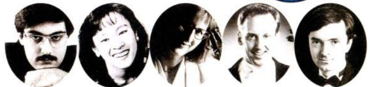
レオニダス・カヴァコス (ヴァイオリン) キヤサリン・チョウ (ヴァイオリン) ディームト・ホッペン (ヴィオラ) ピーター・スタンプ (チェロ) ベーテル・ナジ (ピアノ)

※都合により曲目・出演者等は変更になる場合がありますのでご了承ください。就学前のお子さまの同伴、入場はご遠慮ください。