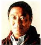
浅井 慎平氏 (写真家)