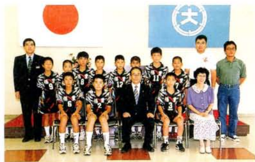
第14回全九州小学生バレーボール男女優勝大会出場・福重バレーボールクラブ (8/16・市役所)