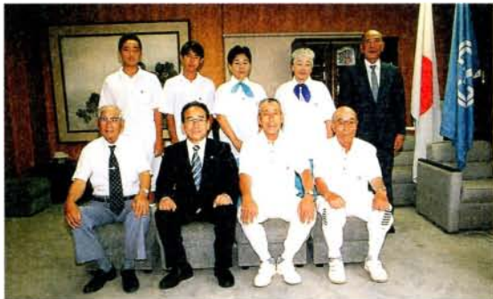
内閣総理大臣杯第16回全日本世代交流ゲートボール大会出場・竹松同好会チーム (8/16・市役所)