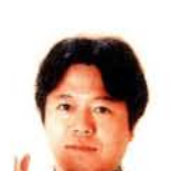
タケカワ ユキヒデ氏 (歌手)