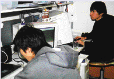
「よかもんネット」のサーバーで作業中のスタッフ