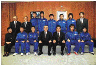
第48回全日本実業団対抗駅伝競走大会（ニューイヤー駅伝）に出場したコマツ電子金属陸上競技部の皆さん（12/17・市役所）