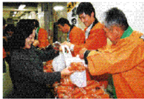
▲長崎県庁での販売・PR活動

黒田五寸人参原種育成会・県央農協中部地区人参加会・JA県央・市が協力して、毎年PR活動を実施しています。