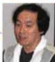
原作：川尻敏生さん