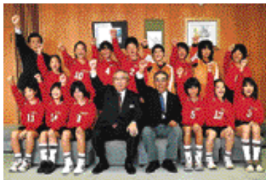
第14回九州ユース（U-12）サッカー選手権に出場した大村チェリーズの皆さん（1/16・市役所）