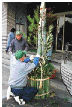
特大門松の寄贈 6大村市シルバ1人材センターから、正月用の特大門松2個を市役所正面玄関前に寄贈していただきました。ありがとうございました。(12/19・市役所)