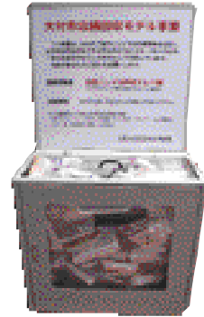
店舗回収モデル事業回収ボックス

卵パック・豆腐パックや白色トレイ以外のトレイ類を、分別してそれぞれの回収ボックスに入れてください。汚れたものやほかのものなどは決して入れないでください。 店舗に設置してある「牛乳パックや白色トレイの回収ボックス」の中に、指定した資源物以外のものや、ひどい場合にはごみが捨てられています。店舗回収ボックスはごみ箱ではありません。指定した資源物以外のものは入れないでください。