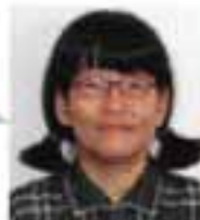
原作：宮崎ヨーコさん

毎回の指導で 新しい感動の 連続。き っと何かを 感じ取って いただける はずです。 どうぞご 覧ください。