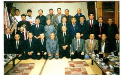
「第41回KTN杯長崎県銃剣道大会」で優勝。5連覇を達成した大村市協会の皆さん。