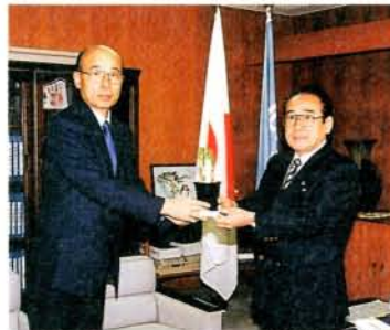
スズランの寄贈 九州電力からスズランが市役所や市内の福祉施設などに贈られました。