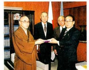
社会福祉基金へ寄付 妙宣寺寒修行団は、各檀家の寒修行で集まったお布施を福祉事業へ役立ててと福祉基金へ寄付されました。