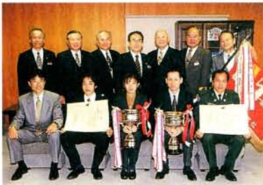
第49回都市対抗県下一周駅伝大会で連覇を果たした大村・東彼チームの皆さん (2/22・市役所)