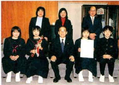
「第28回九州アンサンブルコンテスト」で金賞を受賞した玖島中学校吹奏楽部の皆さん (2/25・市役所)