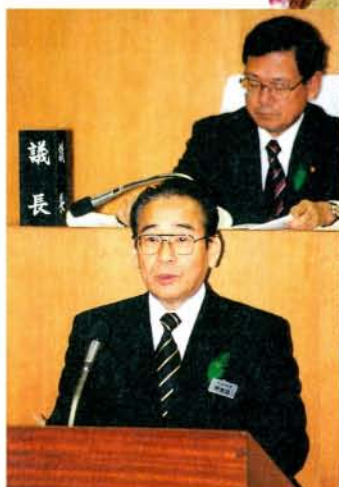
3月定例会で市政方針を説明する甲斐田市長