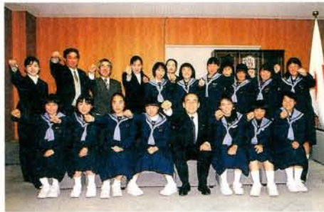
「第10回全九州中学校男女選抜ソフトボール大会」に出場する桜が原中学校ソフトボール部の皆さん (2/25・市役所)