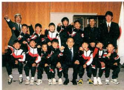
「第5回九州少年サッカー新人大会」に出場するMFサッカースポーツ少年団の皆さん (2/25・市役所)

私達の心はカスタマー・サティスファクション・ 私達の仕事はコンセプト・クリエイター